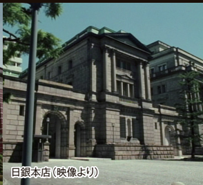
日銀本店(映像より)