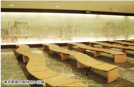
東京駅銀の鈴待合い広場